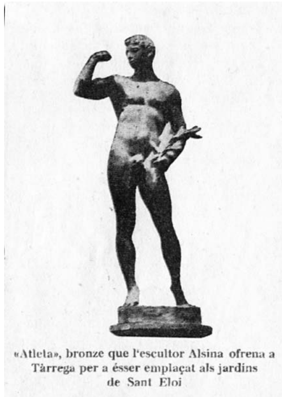
«Atlela», bronze que l'escultor Alsina ofrena a Tàrrrega per a ésser emplaçat als jardins de Sant Eloi

Un cop finalitzada la visita a l'estudi, Alsina va voler mostrar als visitants la seva finca situada al cim del Ti-